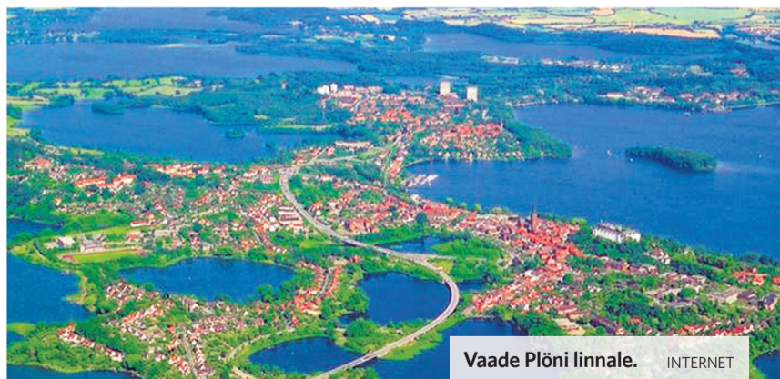
Vaade Plöni linnale. INTERNET

Võrgustikukoostöö eesmärk oli lisaks kogemuste ja teadmiste vaheta-